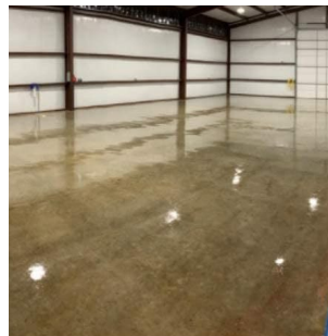
BÊ TÔNG MÀI