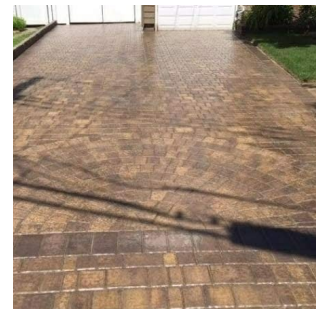
BÊ TÔNG DECOR